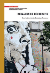
Réclamer en démocratie D. Rousseau (février 2020)