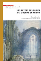
Les revers des droits de l'homme en prison I. Fouchard, A. Simon