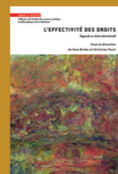
L'effectivité des droits - Regards en droit administratif S. Brimo, C. Pauti