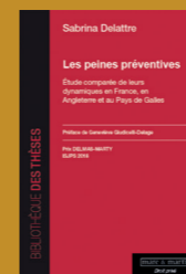
Le prix de thèse Delmas-Marty de l'ISJPS récompense tous les ans une thèse pour son excellence en droit ou en philosophie.

UMR pluridisciplinaire réunissant juristes et philosophes, l'ISJPS analyse le devenir des normes et des catégories face aux mutations du monde contemporain.